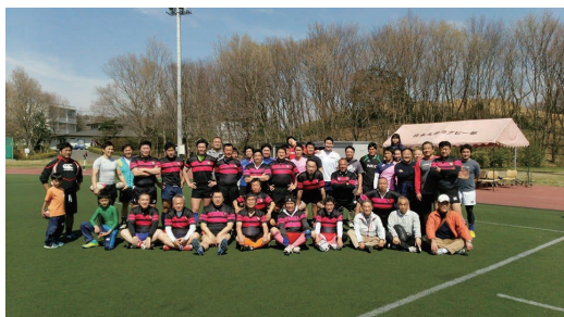
日本大学稲城総合グラウンドに於いて、ゲーム終了後懇親会