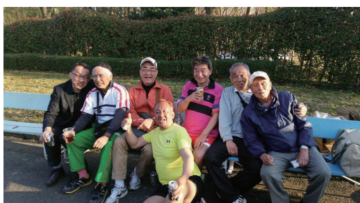
現役学生との交流も含め有意義な時間を持つ事が出来ました