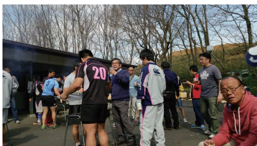
遠方からも数多くの OB の方々にもご参加頂きました