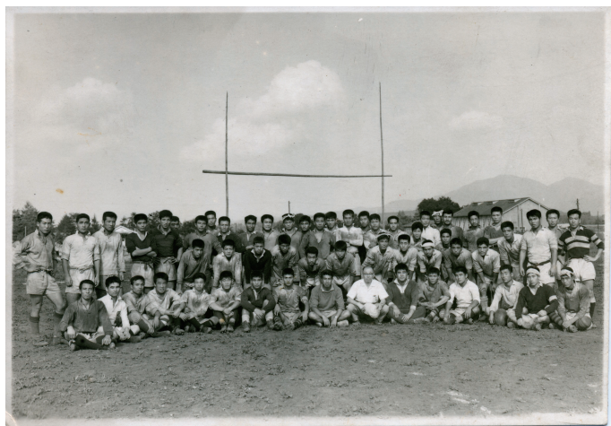
一年時の夏合宿 全体写真

その時代は不衛生ですから、南京虫にやられ、よくDDTを散布しました。私が四年生の時には秋シーズンに赤痢が発生し、多くの部員が入院隔離されるという事態になりました。そのため、法政大学に公式戦の延期を申し出て、最終戦に試合を延期してもらいました。法政大学の厚意により最終戦にのぞむことが出来ましたが、勝つことは出来ませんでした。試合前より勝敗にかかわらず法政大学の勝利と優勝が決定していましたが、負けた悔しさと法政大学の厚意は忘れられません。